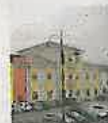
Il municipio di Occhiobello

Un albo delle associazioni di volontariato in vista della costituzione di un forum che le coordini. Le associazioni del territorio hanno tempo fino al prossimo sabato 16 maggio, come previsto dal regolamento approvato recentemente in Consiglio comunale, per presentare alla segreteria generale i moduli e documenti necessari all'iscrizione. La presenza nell'albo è indispensabile per