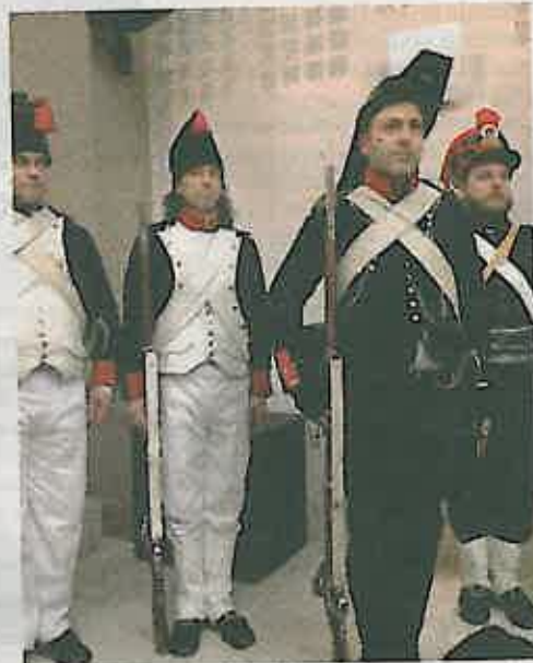
Successo della serata Risorgimentale

lentino, Pollenza, Macerata, Castel di Sangro e Pizzo Calabro per celebrare il fatto storico nazionale e gli avvenimenti di carattere locale che coinvolsero il territorio, ha recentemente contribuito a promuovere nuovi studi e approfondi-