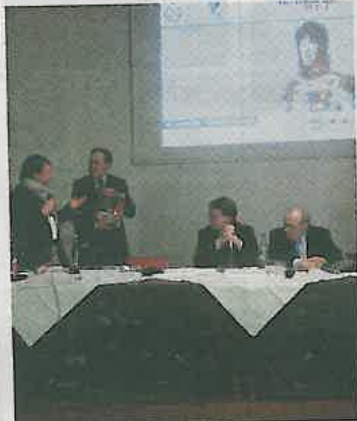
Convegno sul bicentenario a Occhiobello

Una delegazione di Occhiobello sarà a Tolentino, nelle Marche, da oggi fino a domenica 3 maggio per la ventesima rievocazione della storica battaglia di cui fu protagonista Gioacchino Murat contro le truppe austriache. Prosegue il calendario delle manifestazioni che, a livello nazionale, fino a ottobre rievocheranno il bicentenario della campagna militare del re di Napoli per l'indipendenza e l'unità della nazione e che ha avuto un momento di approfondimento molto importante anche a Occhiobello qualche settimana fa. Occhiobello sarà presente alla manifestazione di Tolentino, Macerata e Pollenza con il film "Come mirano giusto costoro" di Ferdinando De Laurentis, ispirato alle vicende successe a Occhiobello tra il 7 e l'8 aprile 1815. Della battaglia di Occhiobello, inoltre, intesa come l'inizio della fine del sogno murattiano, relazioneranno al convegno di Macerata gli studiosi polesani Maurizio Romanato e Alberto Burato. Il comune di Occhiobello, in rete assieme a Rimini, Cesenatico, To-